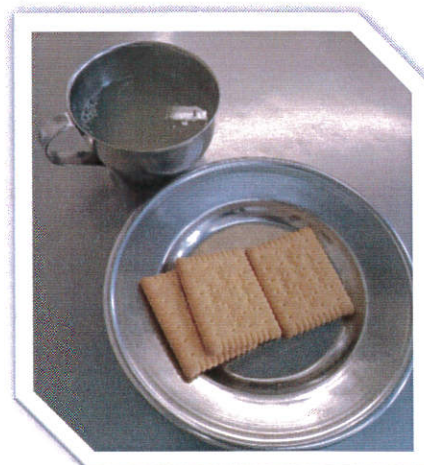
Užina 2: Limunada, mliječni keks