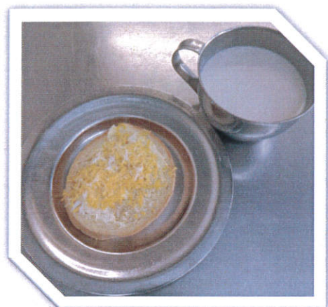
Doručak: Kakao, čupavi sendvič