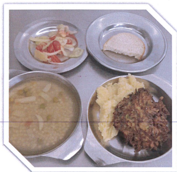
Ručak: Ajngemaht juha, pohane tikvice, pire krumpir s dodatkom celera, miješana salata, kruh sa sjemenkama